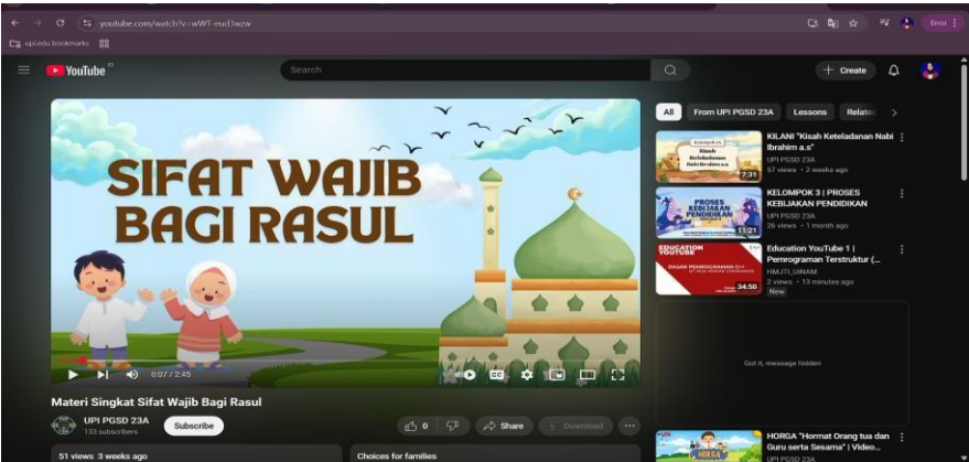
Gambar 4. Video Materi Pembelajaran

Setelah itu semua proses desain e-book selesai, e-book diuji kelayakannya oleh ahli materi dan ahli media melalui instrumen validasi. Hasil dari tahap ini adalah dokumen spesifikasi teknis yang siap untuk dilanjutkan ke tahap pengembangan lebih lanjut.