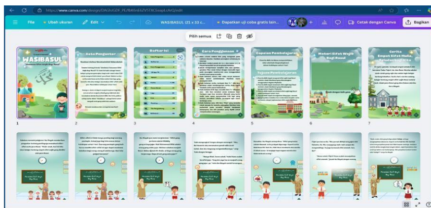
Gambar 1. Desain E-book di Aplikasi Canva

Setelah tahap design , masuk pada tahap develop atau pengembangan, dimana rancangan e-book mulai dikembangkan. Software berupa platform yang digunakan adalah Canva, Heyzine Flipbook , YouTube dan Educaplay sebagai alat bantu untuk membuat media pembelajaran dan mengintegrasikannya untuk menciptakan media interaktif bagi siswa.